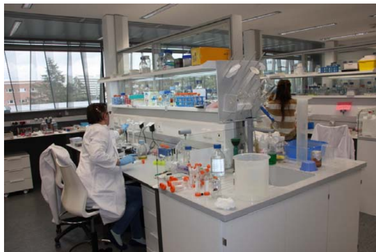
Laborategi baten ikuspegia.

Txosten hau egiteko aldian, bi hitzarmen sinatu dira Nafarroako Unibertsitate Publikoarekin unibertsitateko ikertzaileak Navarrabiomeden integrazteko.