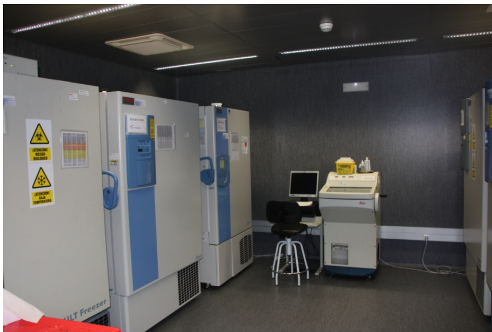
Biobankuko hozkailuak, non ehunak 80 gradutik beherako tenperaturan gordetzen baitira.