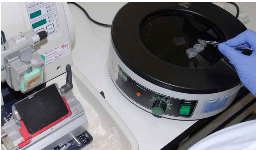
Navarrabiomeden laborategietako bat

Oro har, ikerketa zentroetan egitura finkoko atal bat badago, zeina diru-sarrera orokorrekin finantzatu behar baita, eta, bestetik, proiektuen gastuak daude, hainbat ikerketa-plan edo -lehiaketetatik heldutako diru-laguntzekin finantzatzen direnak. Hori dela eta, garrantzitsua da jakitea zenbateko finantzaketa lortzen den, horrek ikerketak egiteko aukera ematen baitu.